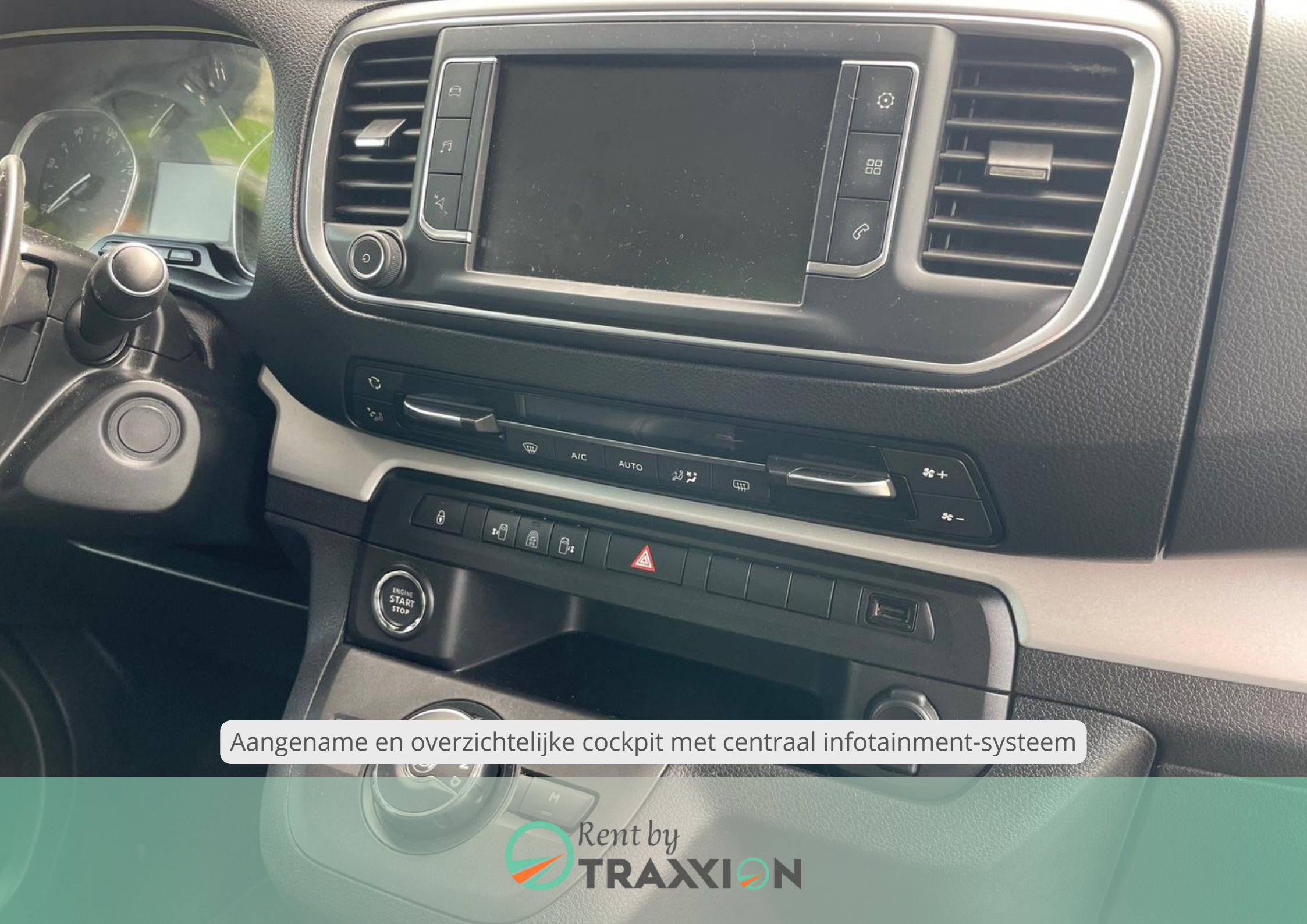
Aangename en overzichtelijke cockpit met centraal infotainment-systeem