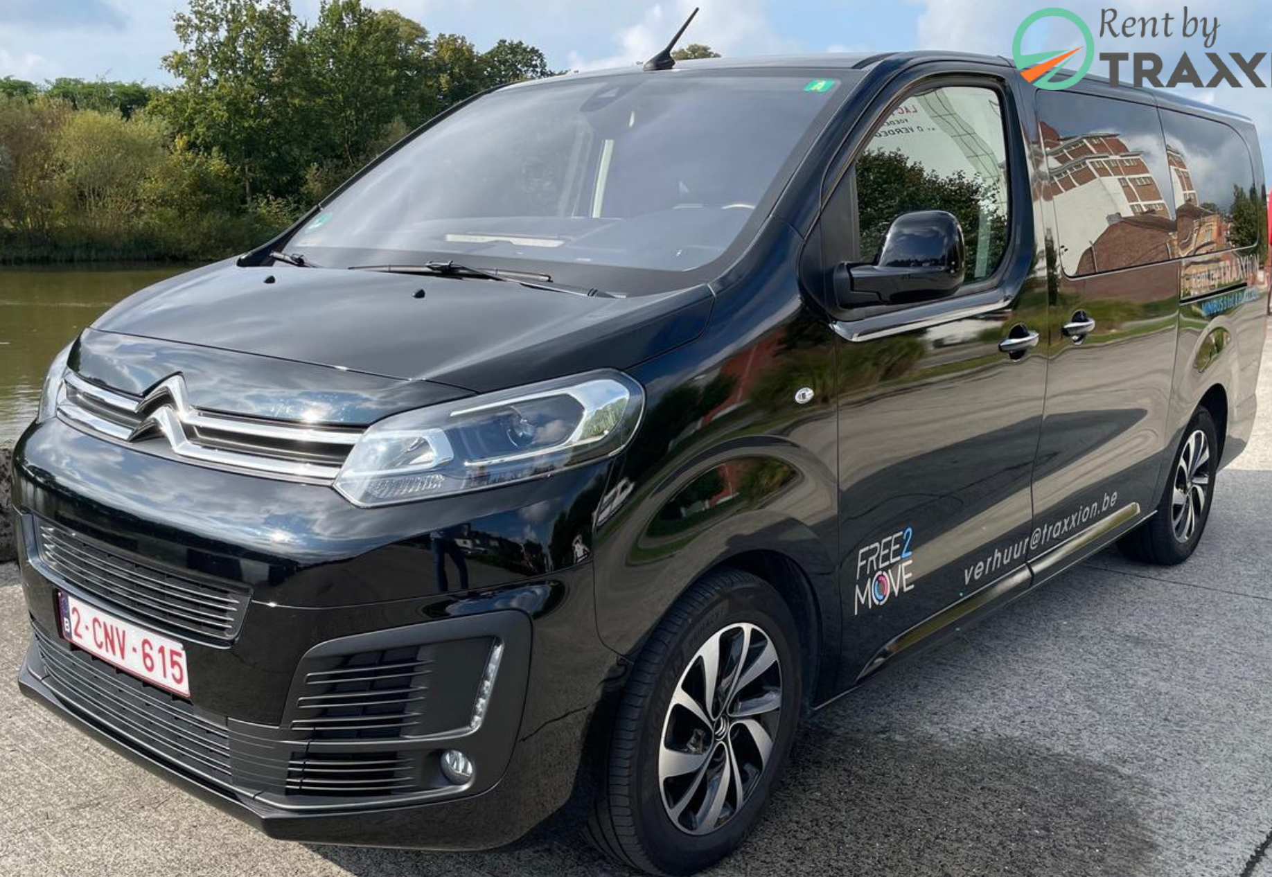
Citroën Spacetourer 7 zitplaatsen 2-CNV-615 (DIESEL)