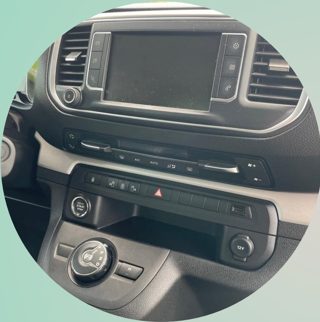
12V voor- en achteraan & klassieke USB-poort