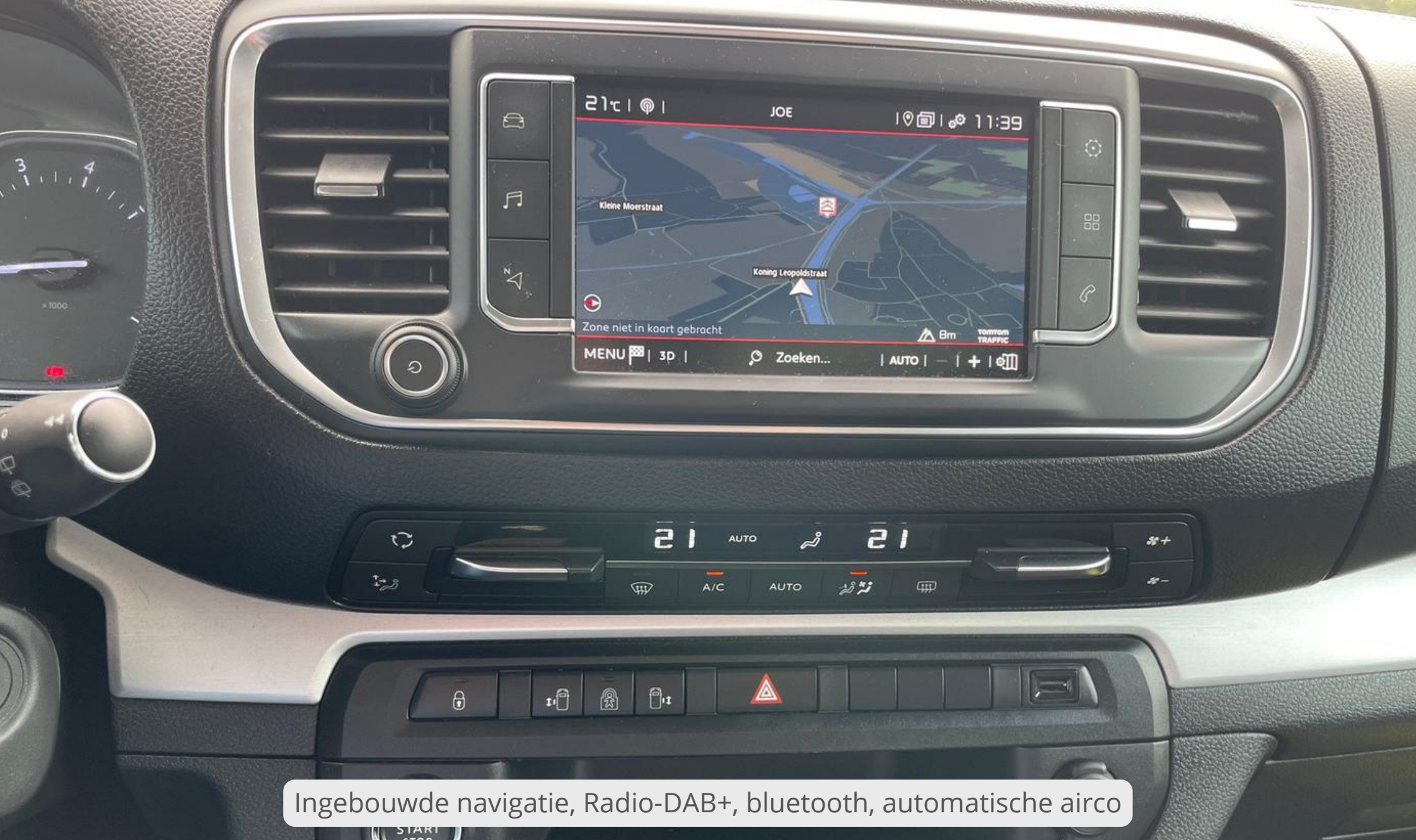
Ingebouwde navigatie, Radio-DAB+, bluetooth, automatische airco