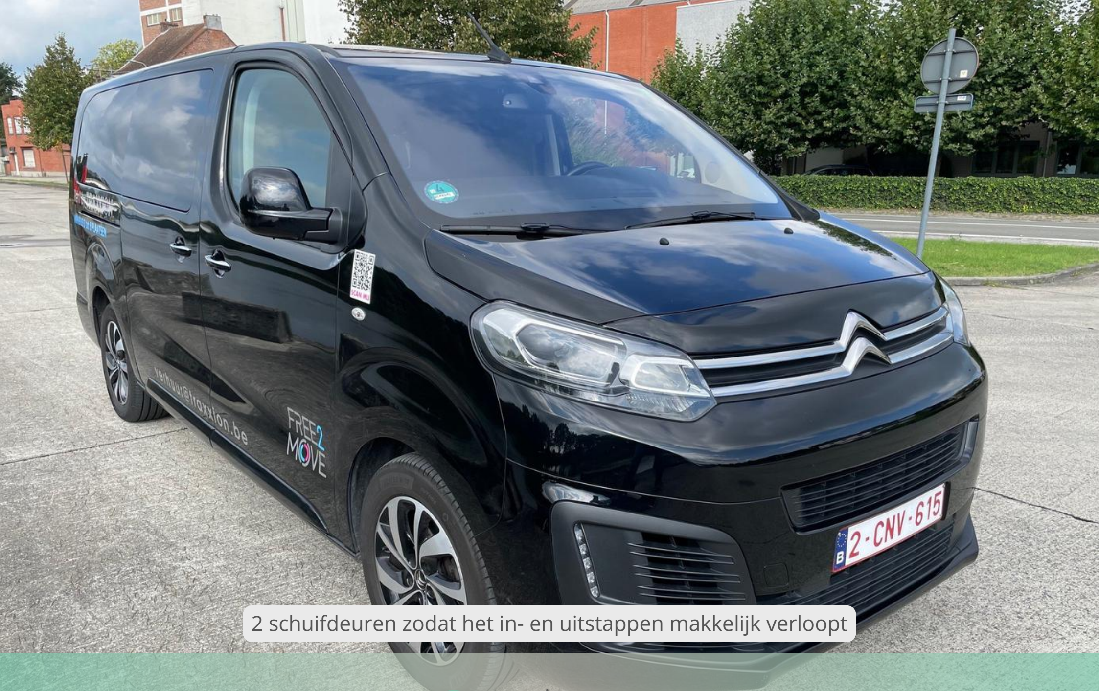
2 schuifdeuren zodat het in- en uitstappen makkelijk verloopt