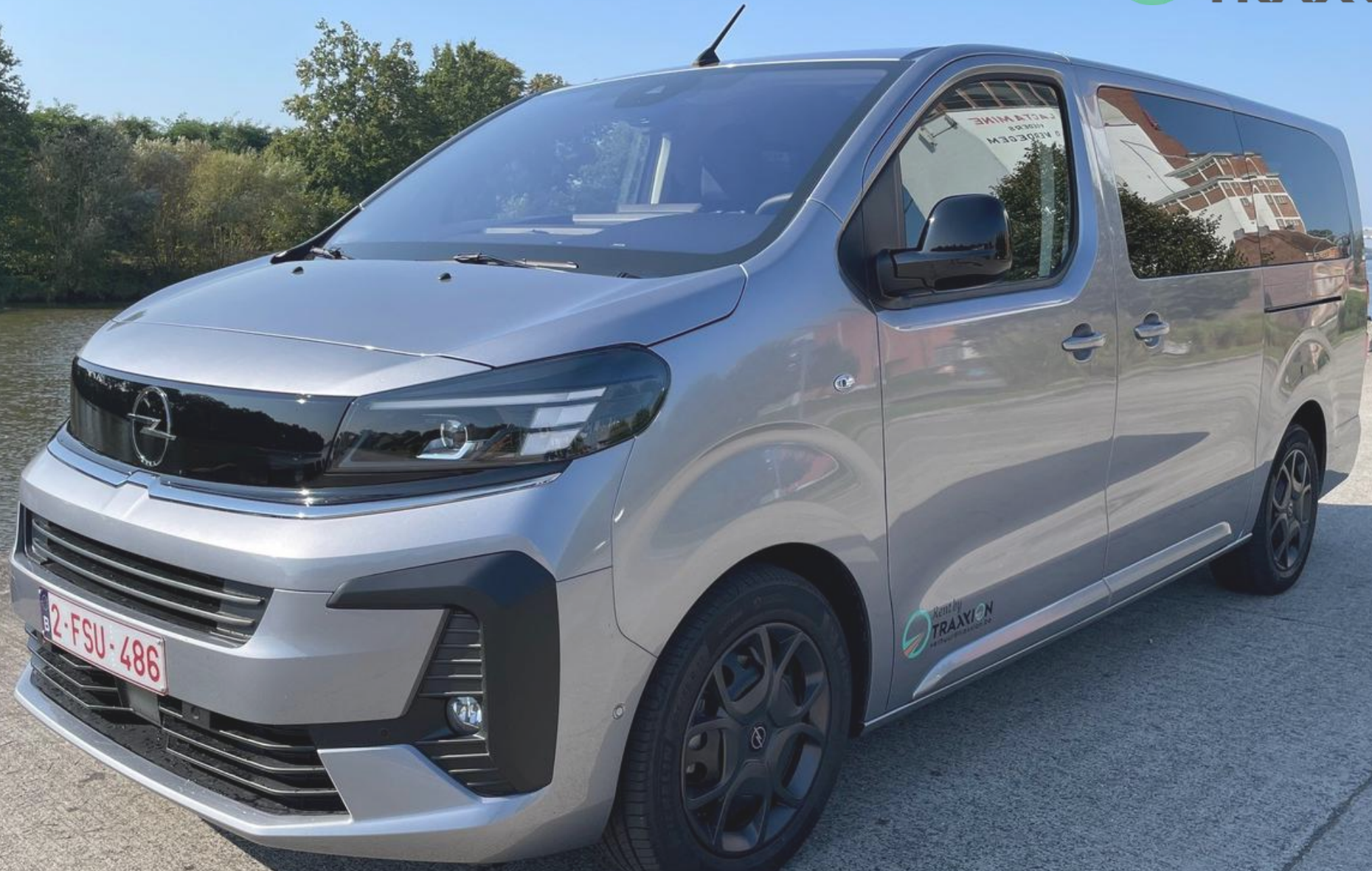
Opel Zafira XL 9 zitplaatsen 2-FSU-486 (DIESEL)