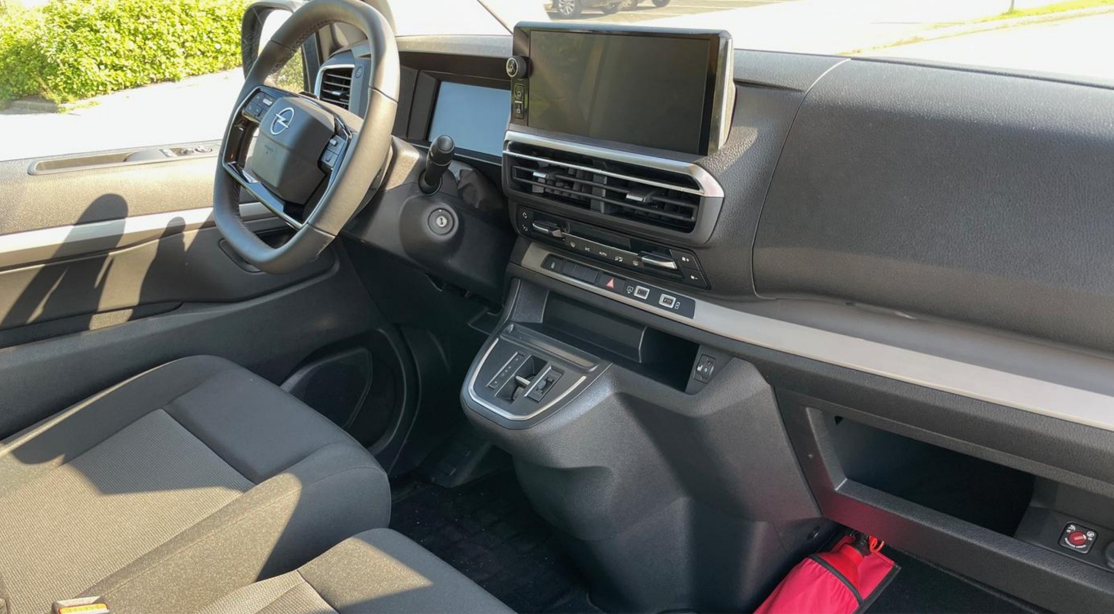
Aangename en overzichtelijke cockpit met digitaal instrumentenpaneel en centraal infotainment-systeem