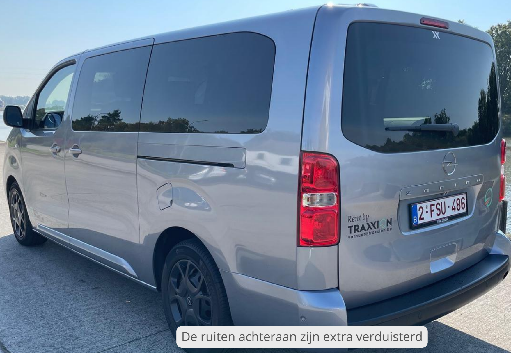
De ruiten achteraan zijn extra verduisterd