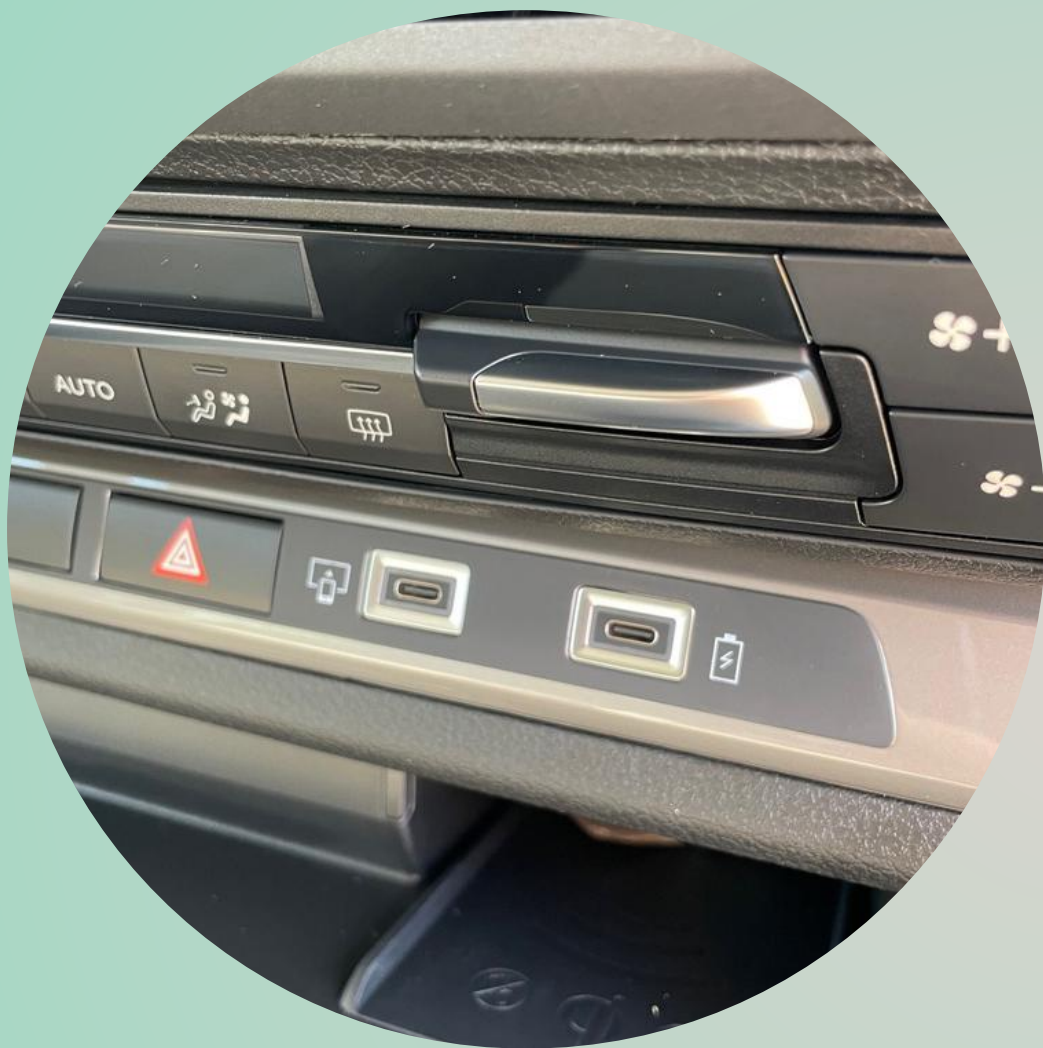
2 x USB-C poort vooraan