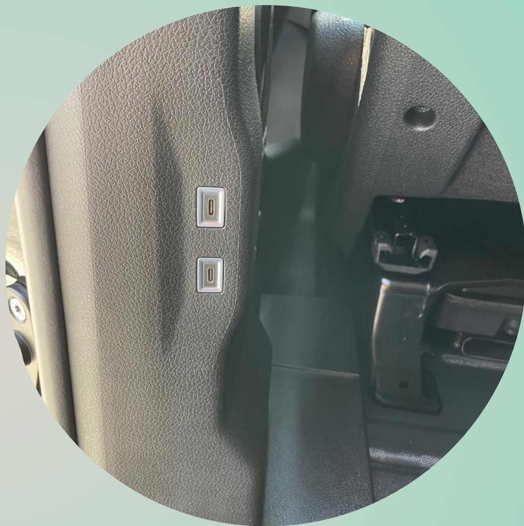
2 x USB-C poort achteraan