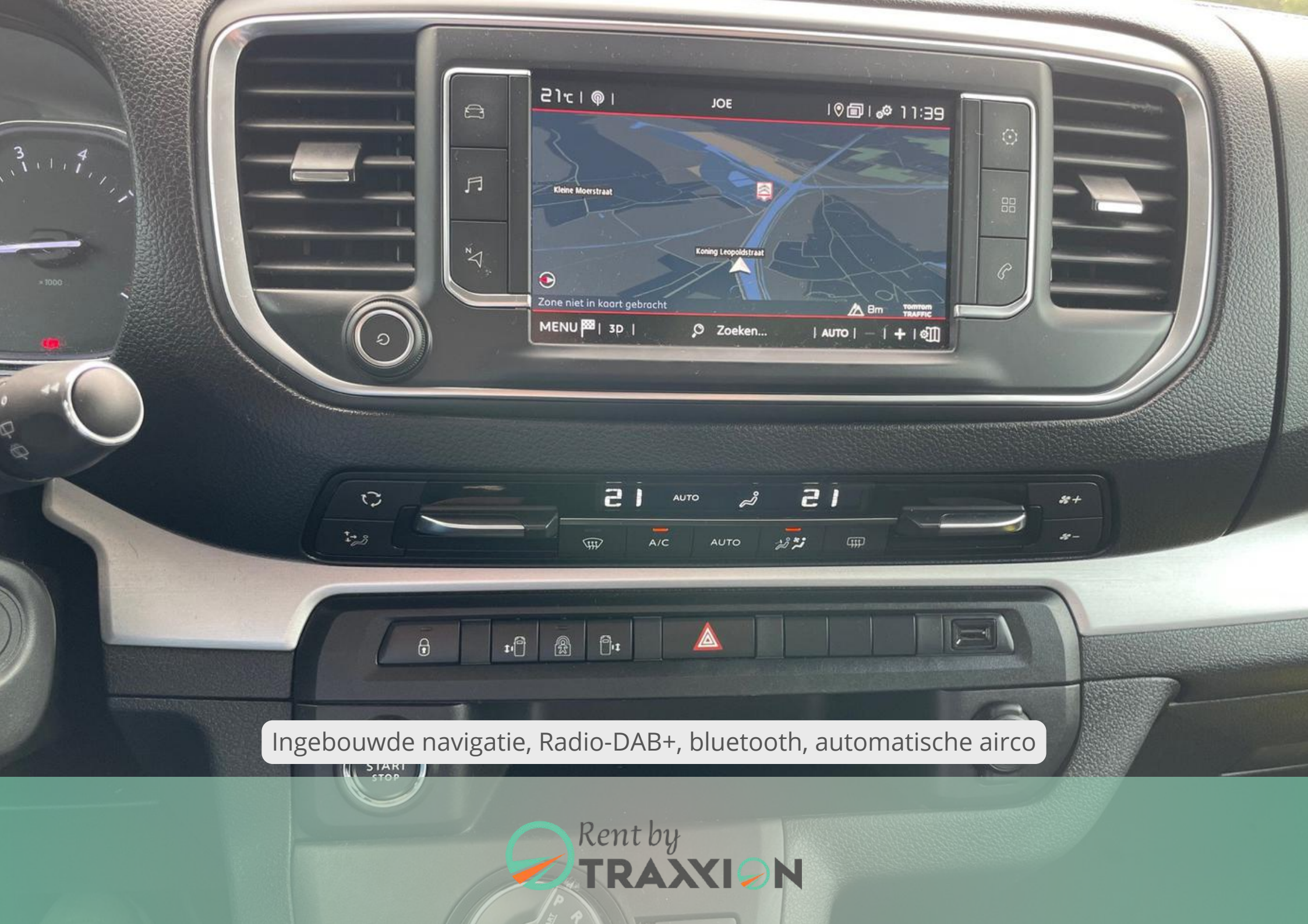
Ingebouwde navigatie, Radio-DAB+, bluetooth, automatische airco