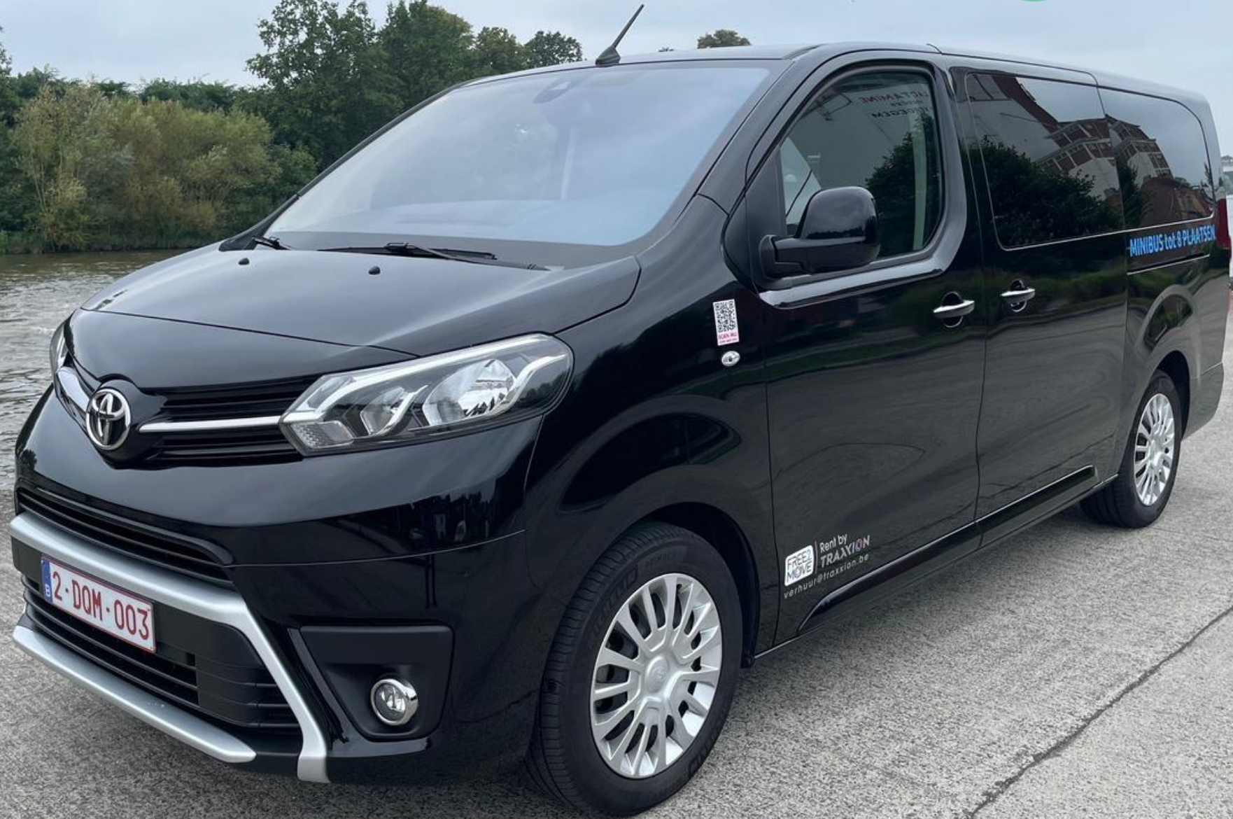
Toyota Proace 8 zitplaatsen 2-DQM-003 ( DIESEL )