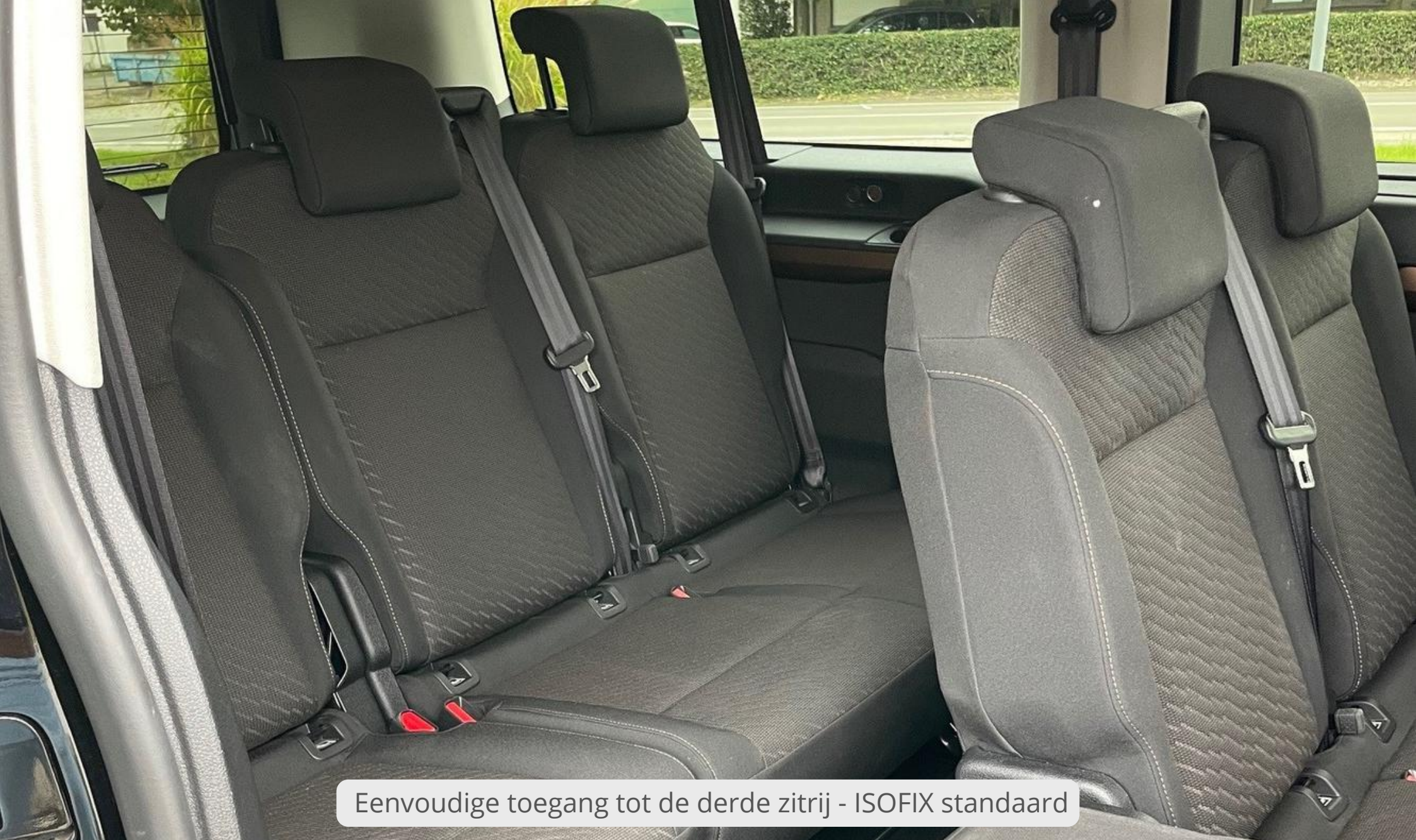
Eenvoudige toegang tot de derde zitrij - ISOFIX standaard