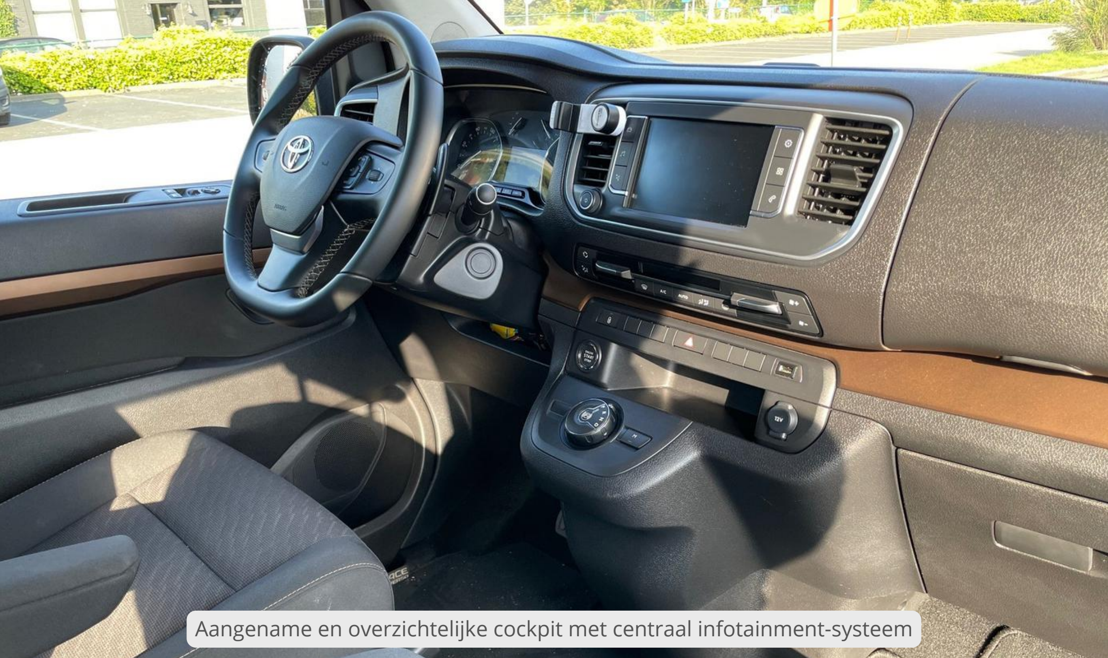
Aangename en overzichtelijke cockpit met centraal infotainment-systeem