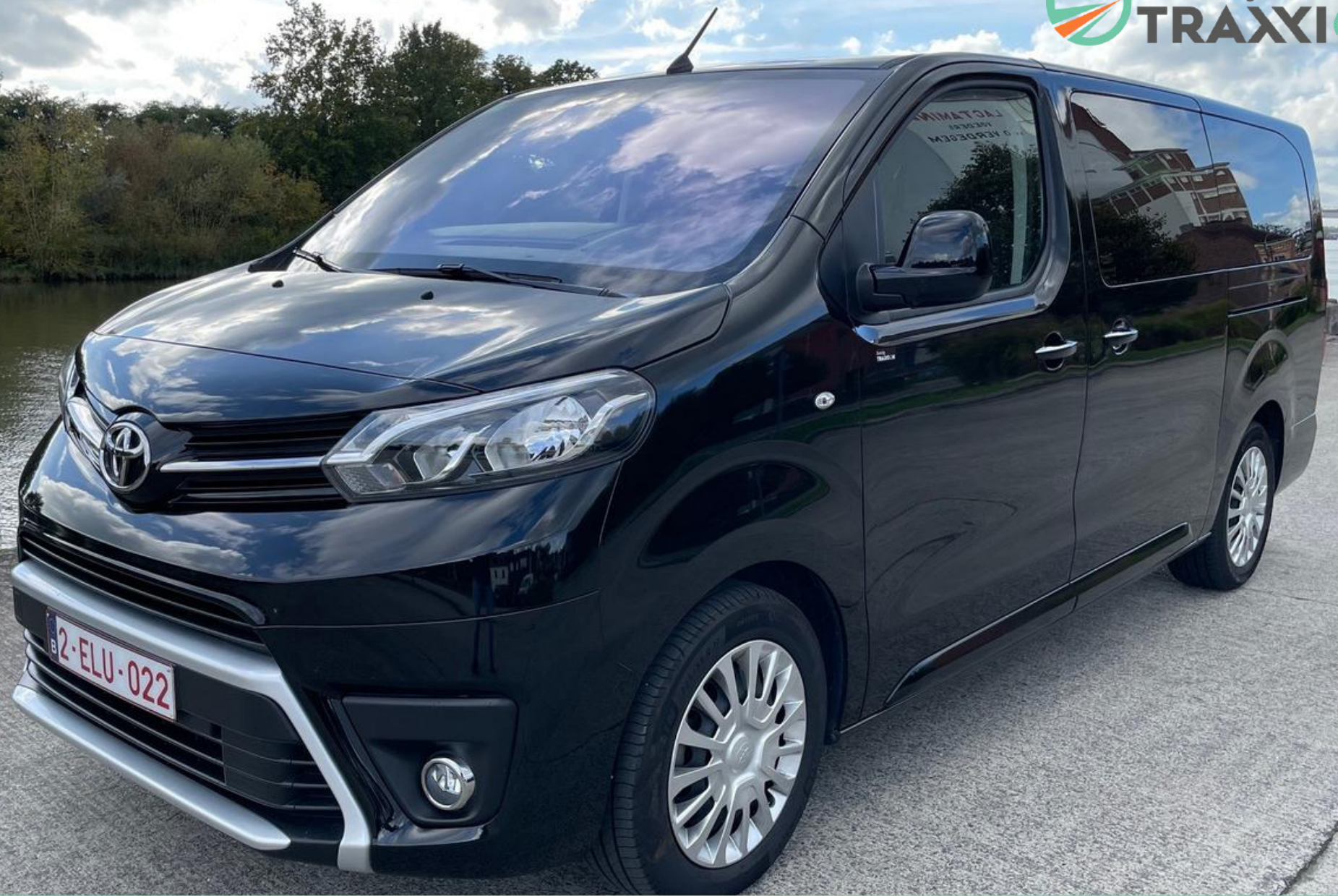
Toyota Proace 8 zitplaatsen 2-ELU-022 (DIESEL)